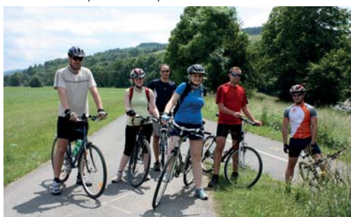
Cyklisté na trase