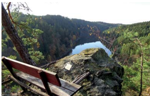
Pohled ze skály Halířka na přehradu