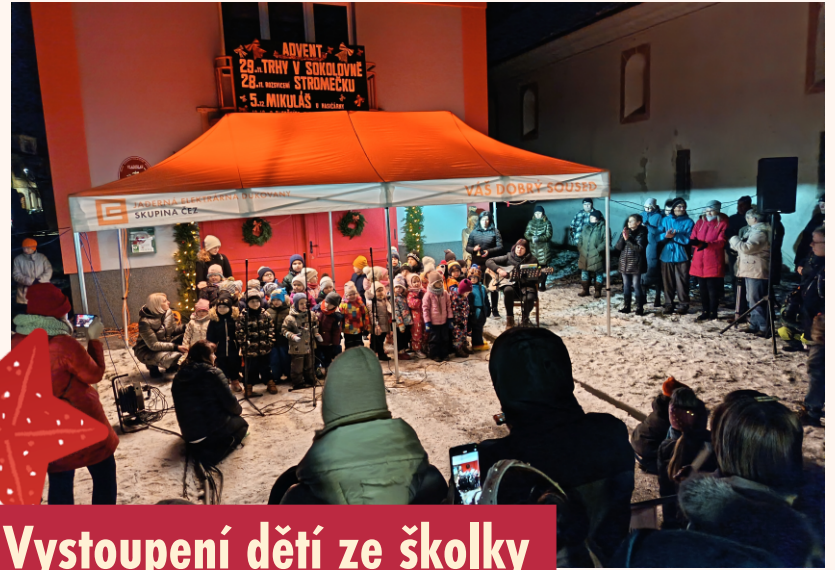
Vystoupení dětí ze školky