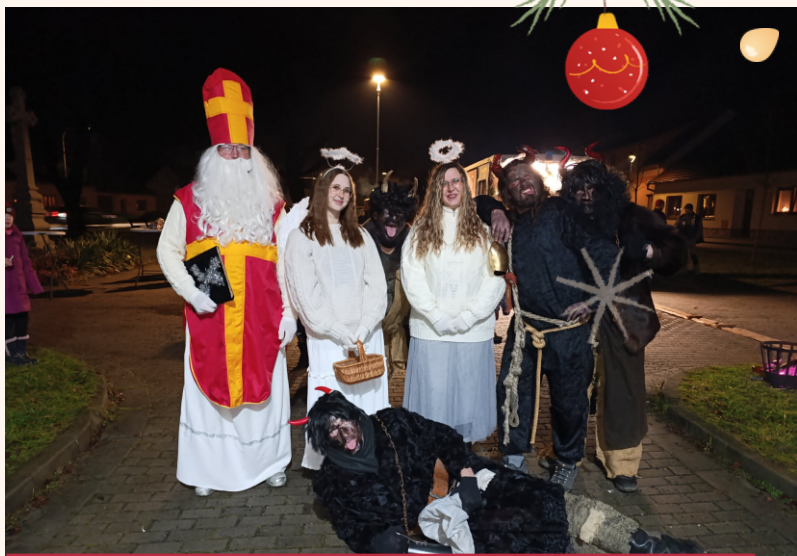
Mikulášská nadílka a čertovský rej