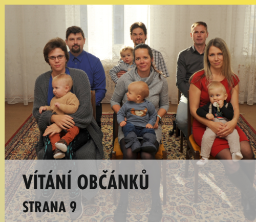
VÍTÁNÍ OBČÁNKŮ STRANA 9