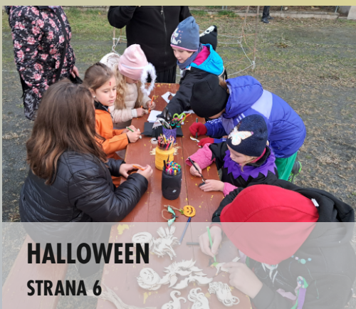
HALLOWEEN STRANA 6