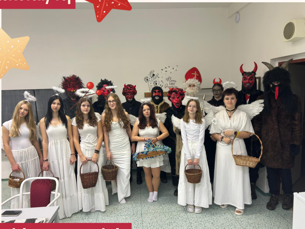
Mikuláš, andělé a čerti ve škole