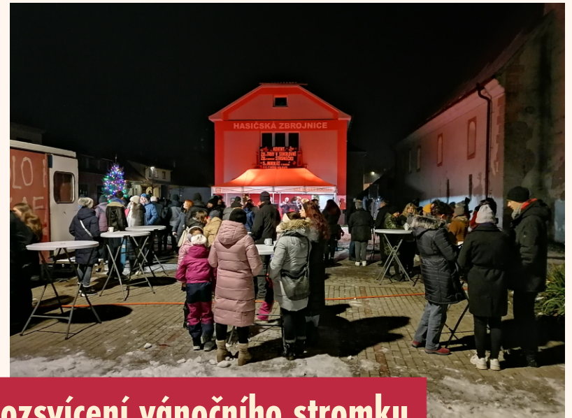
Rozsvícení vánočního stromku