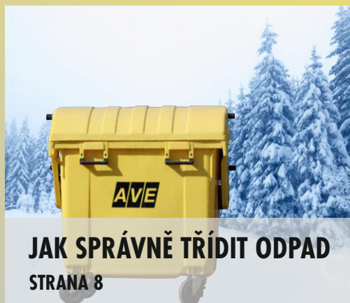
JAK SPRÁVNĚ TŘÍDIT ODPAD STRANA 8